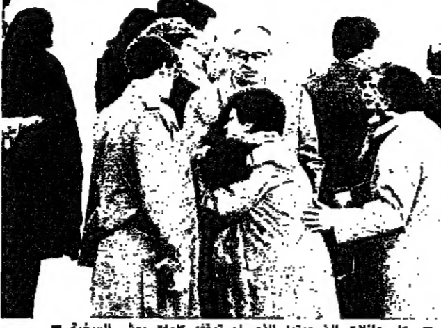
بغاء عائلات الضحايا الذي لم تولفه كلمات بوش السخية